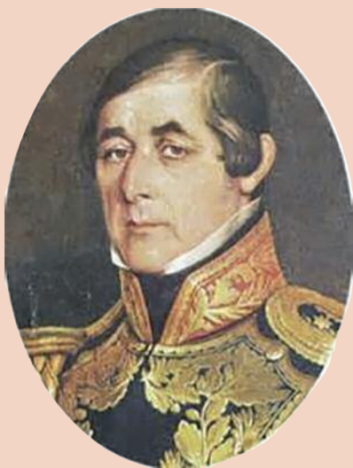
Gral. Fructuoso Rivera

1º de Noviembre de 1838: Presentada el 24 de octubre por el Gral. Oribe la renuncia a la presidencia de la República, salió él mismo para Buenos Aires el 27. Entra triunfalmente en la capital el Gral. Rivera. De este modo termina la revolución riverista iniciada el 16 de julio de 1836.