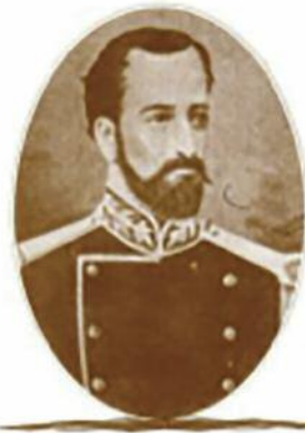
Coronel Ignacio Warnes García (1770-1816)

21 de Noviembre de 1816: Fallece en la batalla de Pari, en el Alto Perú, José Ignacio Warnes, heroico guerrero de la independencia argentina. Desde joven se inició en la carrera militar, integrando el regimiento de Blandengues de Montevideo. Participó en la defensa de Buenos Aires contra los ingleses y formó parte de los ejércitos patriotas. Se destacó por su astucia en la Batalla de Salta. En el Alto Perú se destacó en muchos pequeños y cruentos combates casi olvidados por las páginas de la historia: Santa Bárbara, Horcas, Petacas, Florida, Chiquitos y por último, Pari en la que perdió la vida.