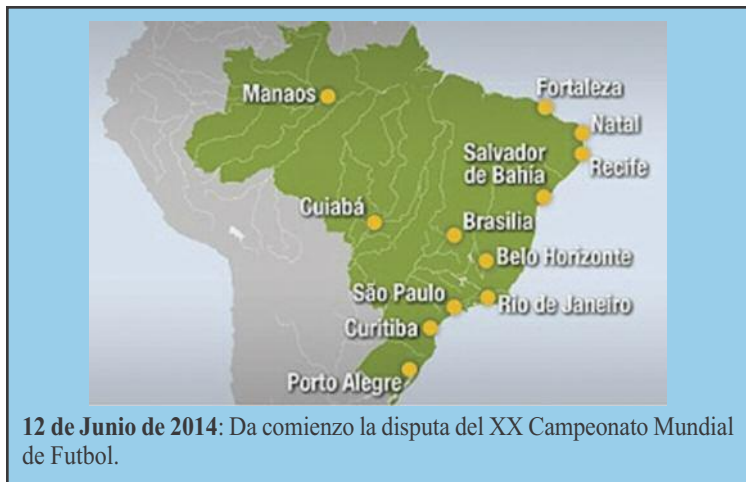
12 de Junio de 2014: Da comienzo la disputa del XX Campeonato Mundial de Futbol.