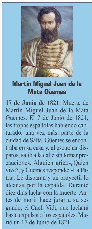
Martín Miguel Juan de la Mata Güemes

15 de Junio de 1916: Nace en Buenos Aires el compositor, arreglador y director de orquestas de tango, Horacio Salgán. Su ejecución pianística es de una depurada exquisitez: conserva la fuerza del tango primitivo con novedosos recursos. Como compositor, ha abordado no solamente el tango, sino también composiciones de espíritu folklórico.